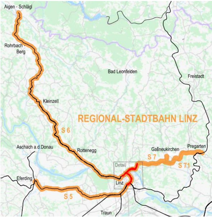
Abbildung 1 Liniennetz der Regionalstadtbahn Linz